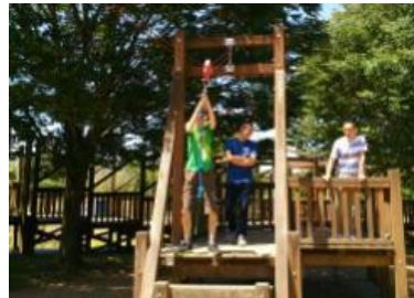
坂田ヶ池公園でハッスル