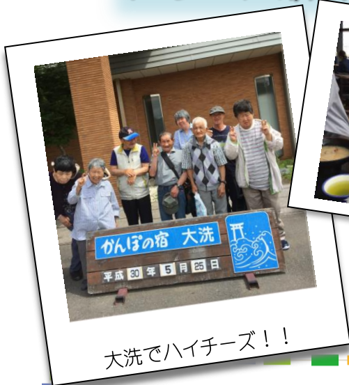
大洗でハイチーズ！！