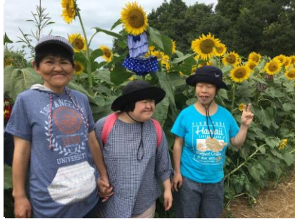
「ひまわり迷路」で大冒険！