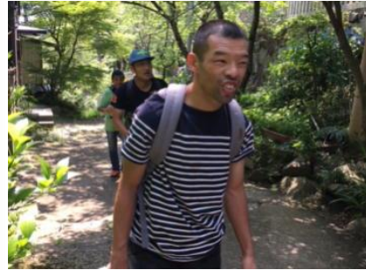
筑波山の頂上を目指して 頑張りました

毎年楽しみにしているレクの季節がやってきました。 「どこに行こうか、あれ食べたい、これ欲しい」の音が あちろちろから聞こえ、皆さん大満足の良い笑顔でした。