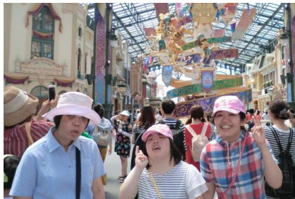
ディズニー1泊旅行に いってきました！

毎年楽しみにしているレクの季節がやってきました。 「どこに行こうか、あれ食べたい、これ欲しい」の音が あちろちろから聞こえ、皆さん大満足の良い笑顔でした。