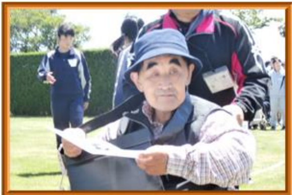
☆何が出るかな？ 借り物競走☆ 紙に書かれたアイテムは見つかったかな？