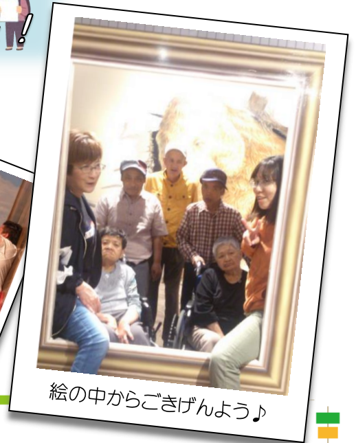
絵の中からごきげんよう♪