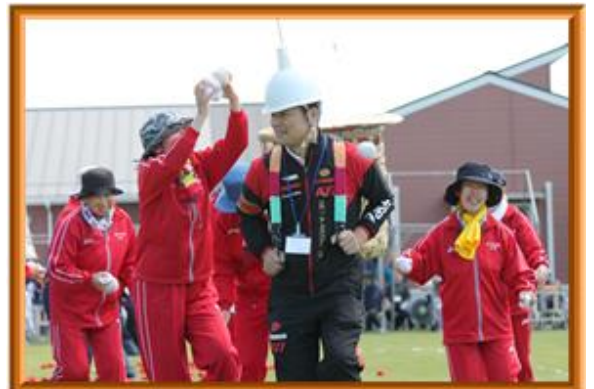
☆カゴが動き出す！？一風変わった玉入れ競争☆ 動くカゴに玉を入れるのはなかなか大変！