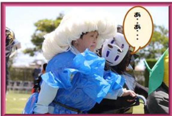
☆のさか学園とすてっぷによる仮装パレード☆ カオナシも一緒に元気に歩きました♪