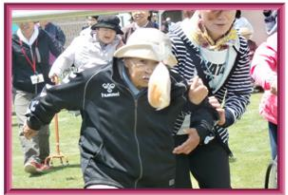
☆毎年恒例パン食い競争☆ この自家製パンがまたサイコーなんです！