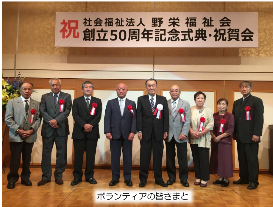
ボランティアの皆さまと

のさか学園 千葉県匝瑳市川辺6166番地 TEL0479-67-5100 FAX0479-67-2888