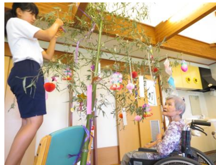
願いが叶いますように♡

六月二十八日、野栄中学校との交流会を行いました。 しおさいホームには、十四名の中学生が夢工房班と、なのはな班に分かれて参加しました。 夢工房班では七夕飾り作りを利用者さんと一緒に行い、二本の笹に飾りました。 中学生の皆さんは作ったことがないようで最初は不安そうでしたが、終わり頃になると自分が作った飾りについてあれこれとお話して盛り上がっていました。また、なのはな班ではリサイクル分別作業とナスの収穫作業を体験して頂きました。