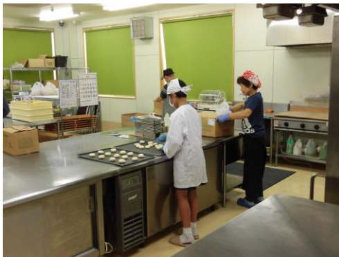
おいしくおいしくおいしくな〜れ♪