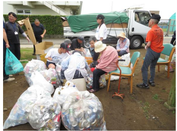
スチール缶とアルミ缶の区別がわかりますか？