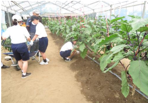
ナスのへたにはとげがあるんだって！