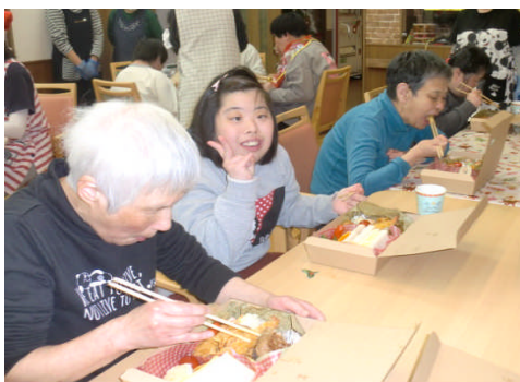
美味しい～お弁当だよ！

2020年は、施設内でクリスマス会を企画し楽しみました。楽しい余興や豪華なお弁当、サンタさんからひとり一人プレゼントを手渡され利用者さんからはとても良い笑顔が伺えました。