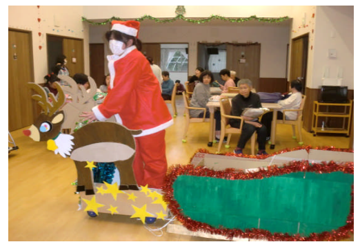
サンタさんがやってきたぞ！

2020年は、施設内でクリスマス会を企画し楽しみました。楽しい余興や豪華なお弁当、サンタさんからひとり一人プレゼントを手渡され利用者さんからはとても良い笑顔が伺えました。